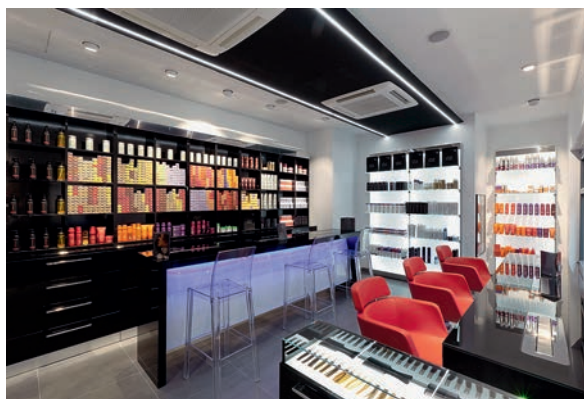
LE BAR DES COLORISTES

Docteur Thierry Lafitte : 9, rue de la Trémoille 75008 Paris