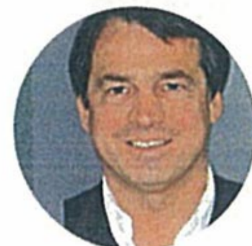
Dr THIERRY MICHAUD dermatologue, président du Groupe de dermatologie esthétique et correctrice

F ini les poils disgracieux ! Il est désormais possible d'afficher des aisselles nettes en toutes circonstances, un maillot nickel, des jambes impeccables toute l'année. La médecine propose plusieurs solutions pour se débarrasser des poils de façon quasi définitive. Tour d'horizon des techniques d'épilation longue durée.